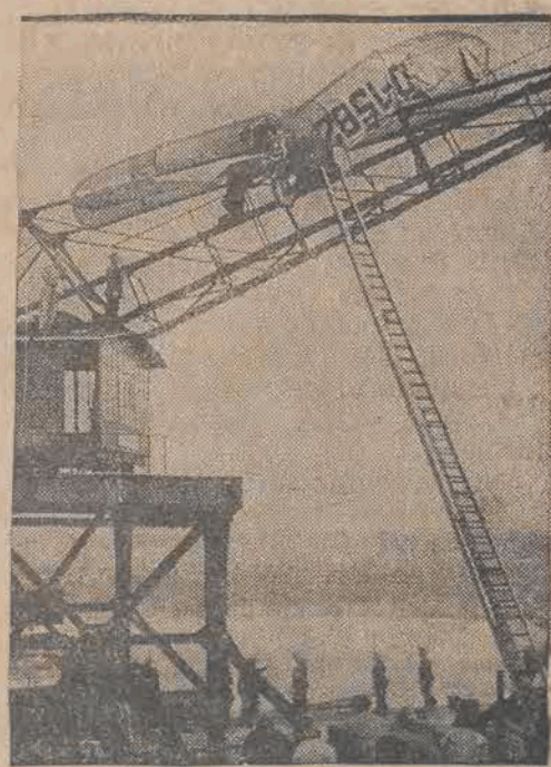
Samolot propagandowy, który w niedzielę krążył nad Berlinem, podczas lądowania wpadł na kran pożarniczy i rozbił się zupełnie. Szczątki zawisły w powietrzu. Pilot cudem tylko uniknął śmierci.