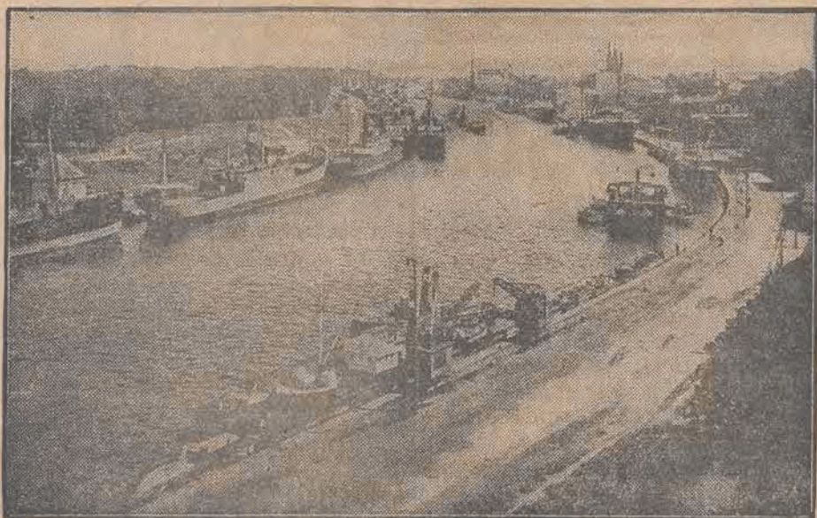
Na zdjęciu naszym podajemy widok Westerplatte pod Gdańskiem, gdzie znajdują się polskie składy amunicji. Jak już donosiliśmy, oddział żołnierzy polskich pilnujący składów, został wzmocniony w obawie przed napaścią bojówek hitlerowskich.