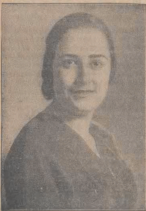
W Madrycie odbyły się wybory królowej piękności. — Na zdjęciu widzimy „Miss Madrid” 1933 roku.