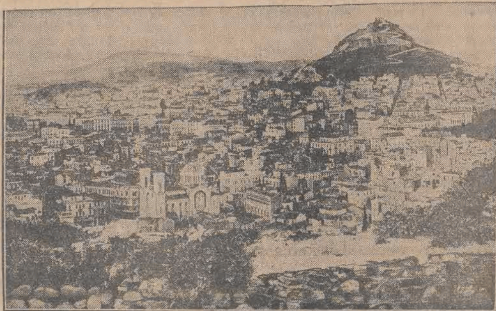
W Grecji dokonany został zamach stanu. Dyktatorską władzę objął generał Plastiras. Na zdjęciu widzimy ogólny widok stolicy Grecji, Ateny. Na tylnym planie — Akropolis.