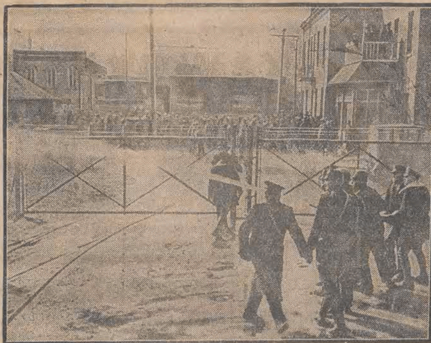
W Haukeshu, w amerykańskim stanie Wisconsin wybuchł strejk robotników. By rozpedzić demonstrujące tłumy, użyto sikawek strażackich.