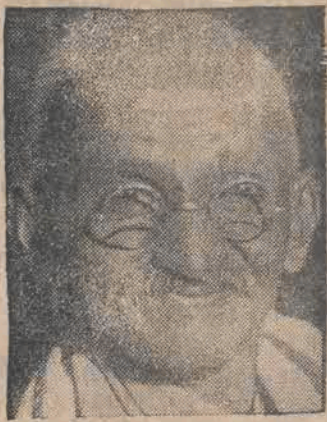
GANDHI, który odbywa głodówkę, ma być wypuszczony na wolność.