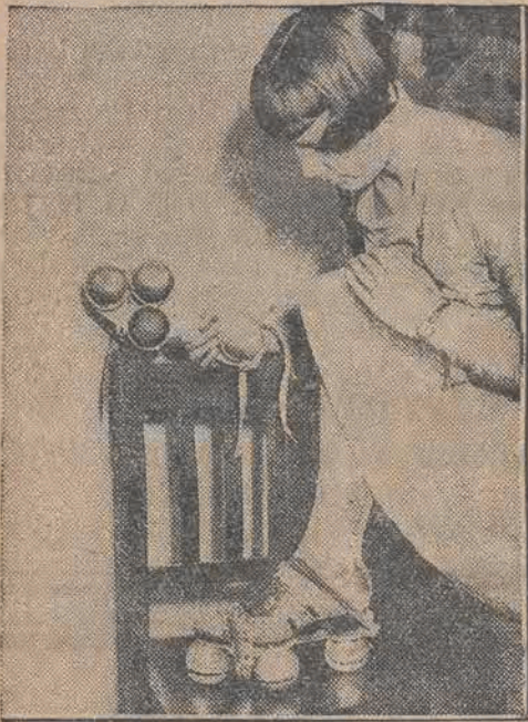
We Francji wprowadzono na rynek wrotki nowej konstrukcji, które zamiast kółek posiadają kule.