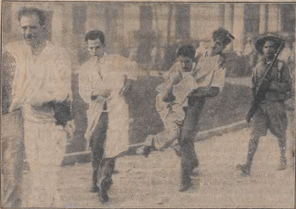
Zdjęcie przedstawia obrońców hotelu „National” w Hawanie, którzy po krwawej walce musieli poddać się wojskom dyktatora Batisty.