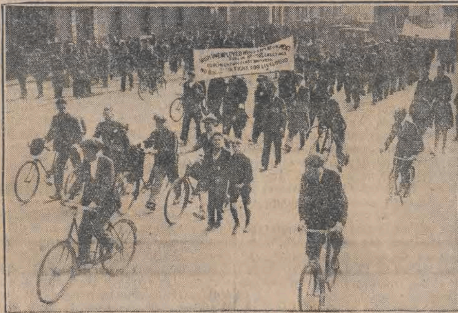
Bezrobotni irlandcy odbyli marsz z Dublina do Belfastu, pragnąc zwrócić uwagę rządu na swą sytuację. Marsz ten odbył się w całkowitym spokoju.