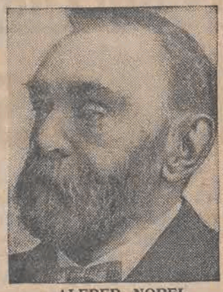
ALFRED NOBEL, twórca „fundacji Nobla” i wynalazca dygamitu. Dnia 21 października Szwecja obchodzi 100-letnią rocz- nicę jego urodzin.

Rok VI | PIĄTEK, 13 PAŹDZIERNIKA 1933 R. | CENA 10 GROSZY | Nr. 284