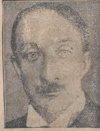
BONNET. francuski minister skarbu zapowiedział redukcję budżetu i utrzymanie dotych- czasowego kursu franka.