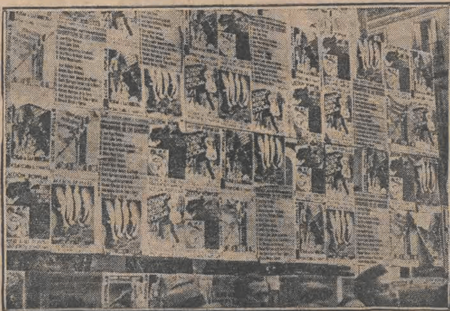
Jak wiadomo, ostatnie wybory w Hiszpanji przyniosły zwycięstwo prawicy, dzięki wydatnemu udziałowi kobiet w głosowaniu. Na zdjęciu wyborcy przed plakatami wyborczymi.