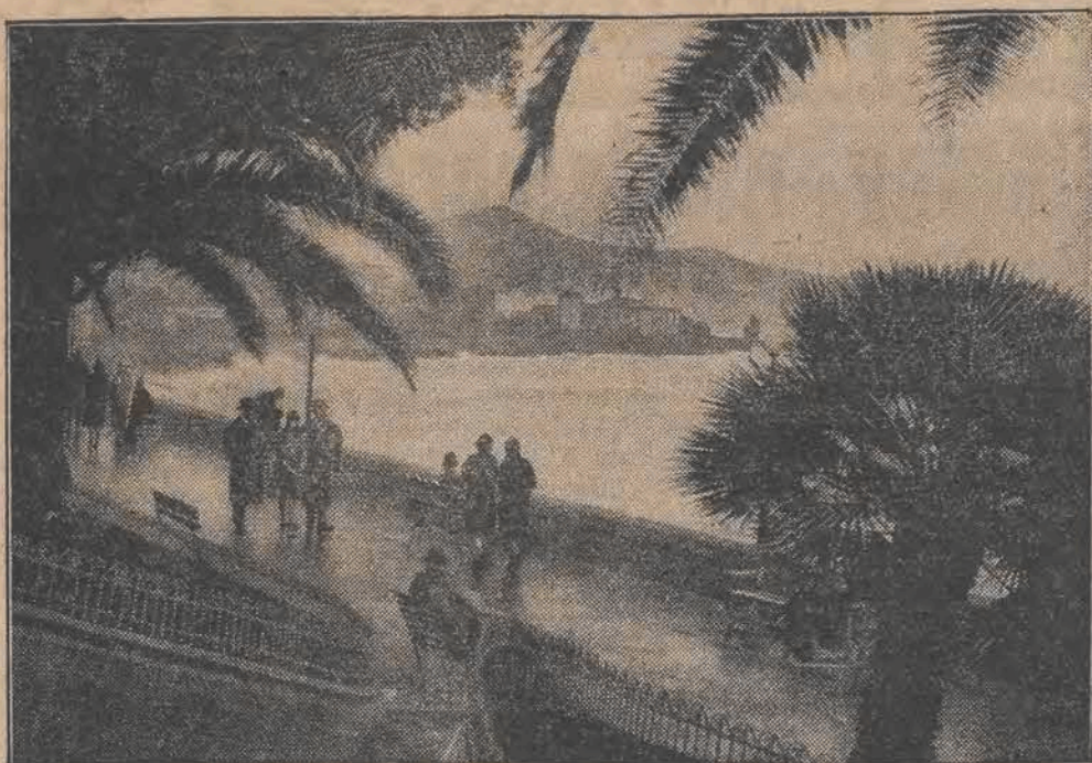
Prasa francuska lansuje wiadomość, iż w kołach ententy stleje pragnienie przeniesienia konferencji rozbrojeniowej z Genewy do San Remo. Na zdjęciu — widok San Remo.