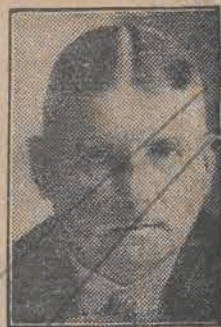
ROEHM były kapitan armii cesarskiej, szef sztabu hitlerowskich oddziałów szturmowych, ma zostać ministrem obrony krajowej.