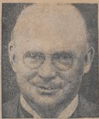
BENNET premier Kanady, zażądał zakazu przywozu drzewa sowieckiego do Anglii, co wywołało zatarg między Anglią i Kanadą.

WYDANIE: A B C D E F G H I J K L M N O P.