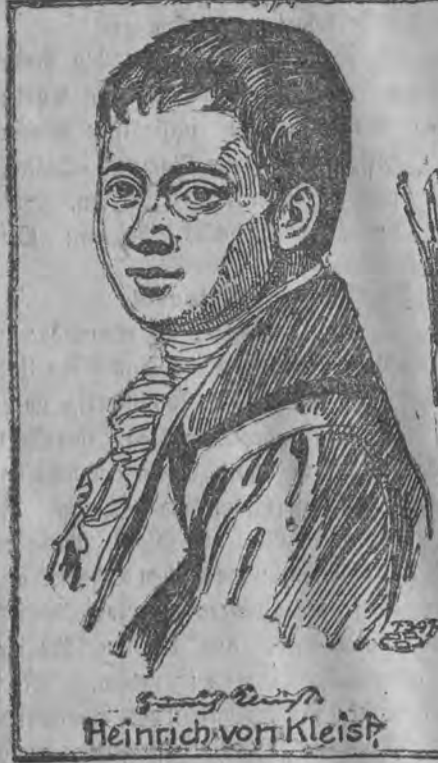
Heinrich von Kleist

Zu den einzelnen Artikeln ergreifen das Wort