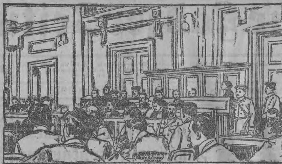
Am Sitzungssaale des Czestochauer Riesenprozesses