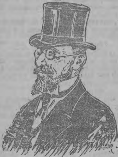
Ks. Wł. Drucki-Lubecki †

To też, gdy u sędziego śledczego Bezmienowa okazano 7 blankietów wekslowych na sumę 350,000 rb., znalezionych w mieszkaniu p. Bispinga, sprawa ta wydała się podejrzaną.