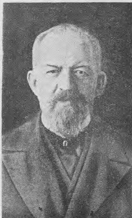
Prof. Kazimierz Twardowski