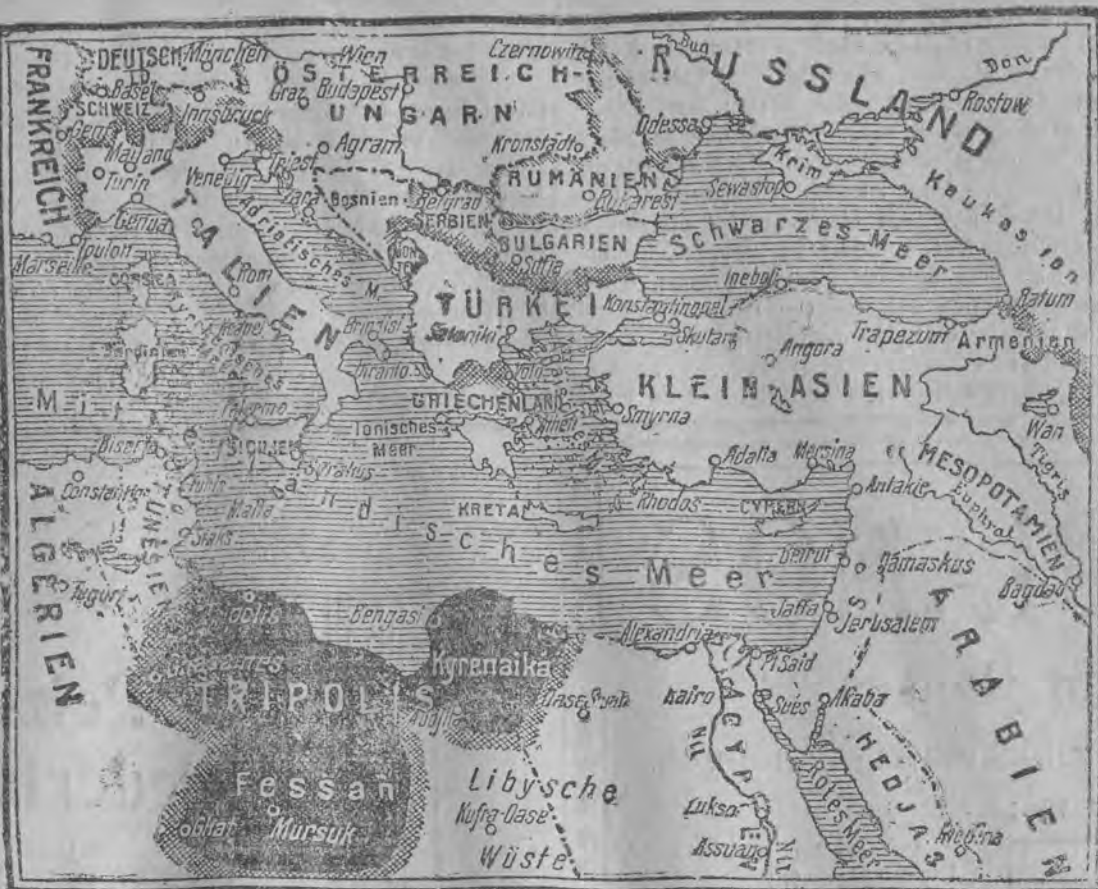
Italiens Gebietszuwachs durch den Frieden von Ouchy.

Wien, 25. Oktober. (Spez.) Der Polenklub des österreichischen Abgeordneten-