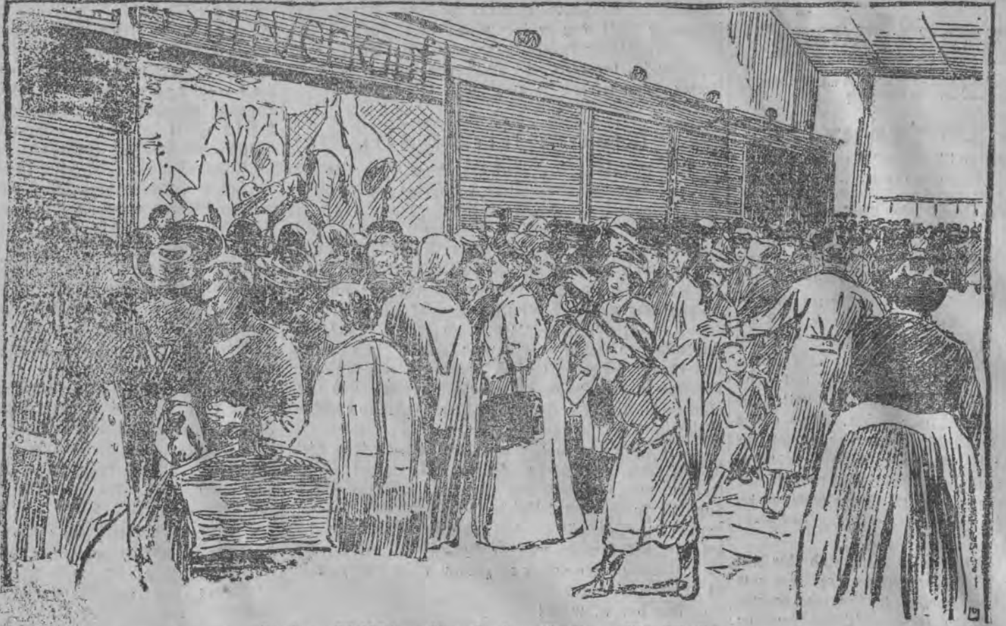
Scene vor dem Stand eines Schlächters in einer Berliner Markthalle, der das in großen Mengen eingetroffene russische Fleisch verkauft.

Das Telephon. Das Telephon ist ein kleiner Kasten, der an der Wand hängt. Alle Lodzer werden in zwei Gruppen geteilt: in solche, die einen solchen Kasten haben, und in solche, die einen solchen Kasten nicht haben.