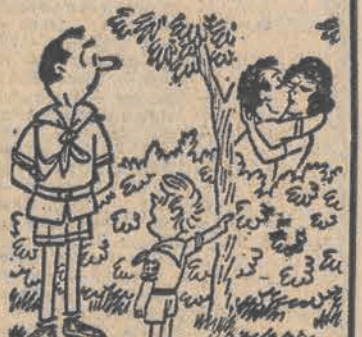
Druku zastępowy, jak się nazywa ta sprawa?