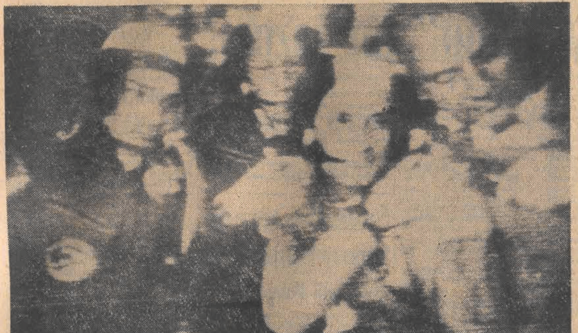
„Rodzinne” zdjęcie radzieckich i amerykańskich kosmonautów na pokładzie SOJUZA podczas pierwszego w historii spotkania w kosmosie astronautów dwóch państw. Od lewej — W. Kubasow, A. Leonow, T. Stafford i D. Slayton.

Eksperyment „Sojuz—Apollo” jest uwięzieniem rozmów i porozumień politycznych, rozwijającej się współpracy gospodarczej ZSRR i USA, współdziałania w dziedzinie nauki i techniki, słowem, całej złożonej struktury pokojowego współistnienia. Nie jest przypadkiem, że lot „Sojuz—Apollo” dzieli niewiele czasu od Konferencji Bezpieczeństwa i Współpracy w Europie. Oba te, chociaż dotyczące zupełnie różnych spraw, wydarzenia, służą wspólnemu celowi: umacnianiu poczucia bezpieczeństwa i wspólnoty mieszkańców Ziemi, są wynikiem odprężenia i sprzyjają jego pogłębianiu.