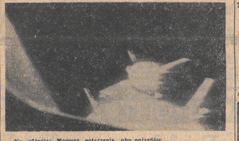
Na zdjęciu: Moment połączenia obu pojazdów CAF — telefoto

Oba statki dzieli już tylko centymetry (Dalszy ciąg na str. 2)