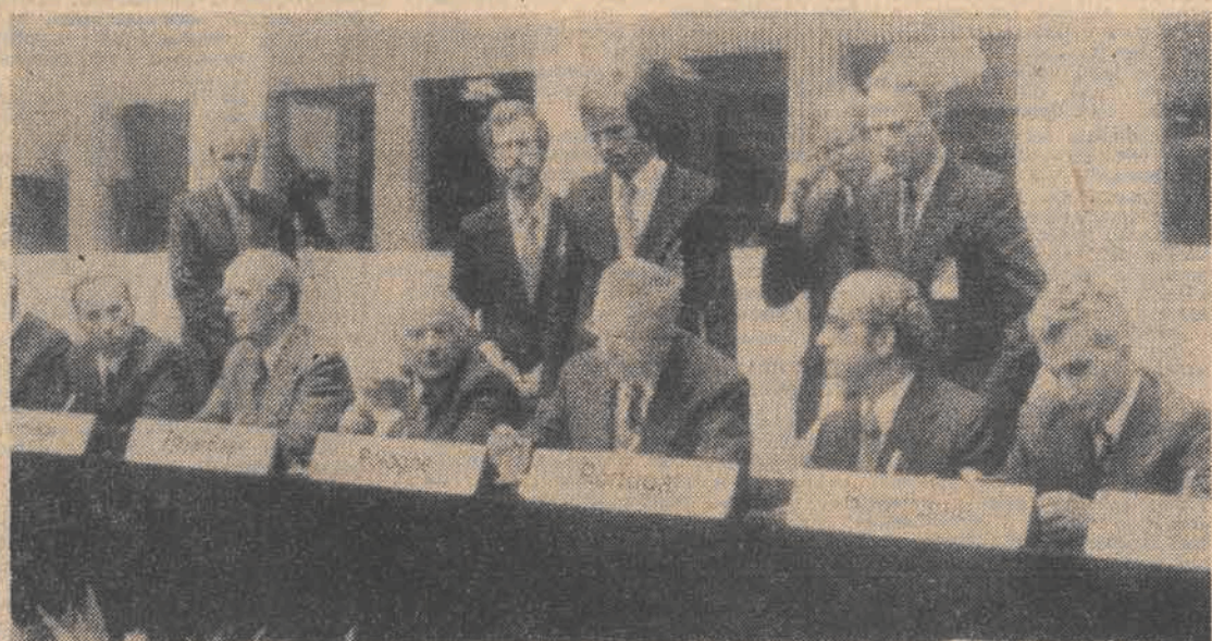
Na zdjęciu: Edward Gierek podpisuje dokument końcowy Konferencji Bezpieczeństwa i Współpracy w Europie.

W PIĄTEK UROCZYSTYM PODPISANIEM DOKUMENTU KOŃCOWEGO PRZEZ PRZEDSTAWICIELI 35 PAŃSTW, ZAKOŃCZYŁA SIĘ TRZECIA FAZA KONFERENCJI BEZPIECZEŃSTWA I WSPÓLPRACY W EUROPIE.