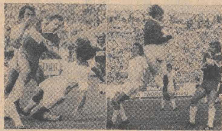
Nr: fragmenty wczorajszych łódzkich derbów pierwszoligowych. (Szczegóły na str. 2) Fot.: A. Wach