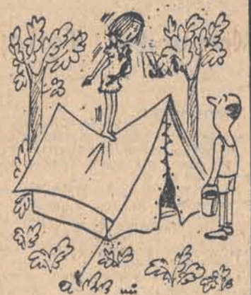
— Tam w namiocie jest mysz!