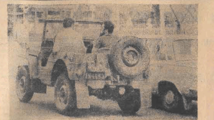
I takie pojazdy można spotkać na ulicach centrum Łodzi...