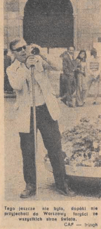
Tego jeszcze nie było, dopóki nie przyjechał do Warszawy turysta ze wszystkich stron świata.