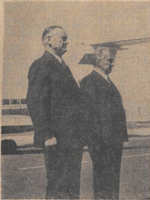
N.z.: premierzy Piotr Jaroszewicz i Aleksiej Kosygin na warszawskim lotnisku.

11 BM., NA ZAPROSIENIE BIURA POLITYCZNEGO KOMITETU CENTRALNEGO POLSKIEJ ZJEDNOCZONEJ PARTII ROBOTNICZEJ I RADY MINISTRÓW POLSKIEJ RZECZYSPOLITEJ LUDOWEJ, PRZYBYŁ DO POLSKI Z WIZYTA PRYJAZNI, CZŁONEK BIURA POLITYCZNEGO KC KPZR, PRZEWODNICZĄCY RADY MI-