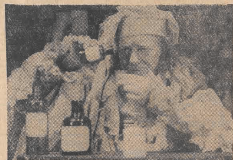
W roli „Argana w „Chorym z urojenia” CAF

Podobno dawniej dla ciekawej konwersacji w salonach jeżdżono nawet za granicę: zobaczyć kolekcje obrazów w muzeum, posłuchać koncertu w wykonaniu znakomitości. Jest wiele szans, żeby tematy te można było znaleźć w zakładach pracy dzięki interesującej, zorganizowanej w miejscu wystawie, spopularyzowanej przez radiowęzły książce, wyświetlonym w zakładowym klubie filmowi. H. SZYPULSKA