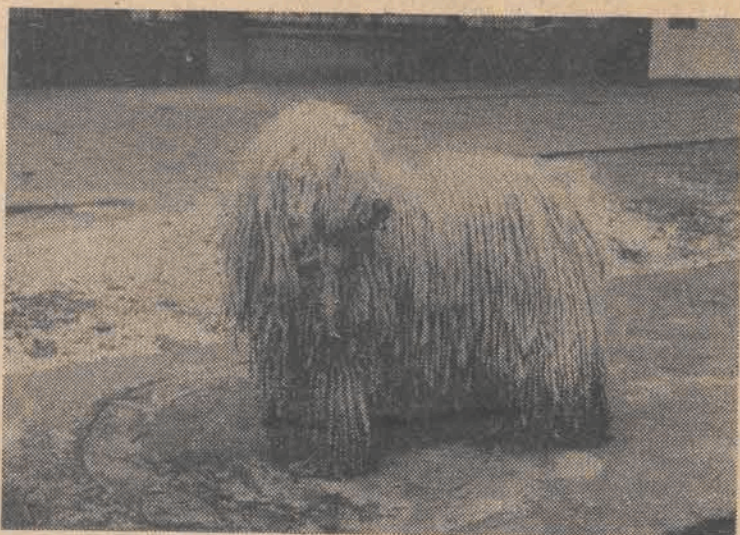
Uff, jak gorąco!