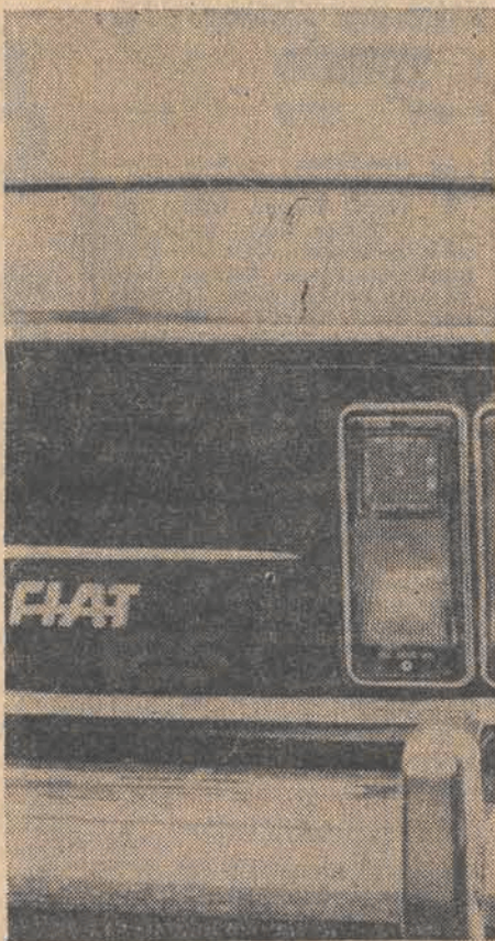
Pierwsza zagraniczna umowa zawarto z firmą „General Motors”, która przystąpiła do montowania w Polsce samochodów...