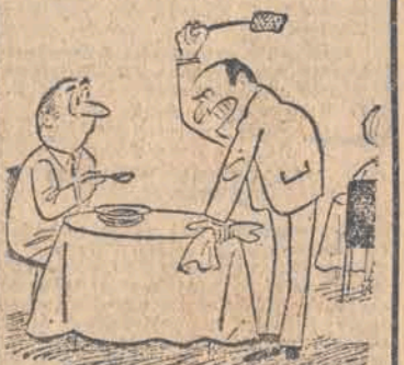
— Przecież ta mucha musi wreszcie wylecieć, żeby zaczerpnąć powietrza!