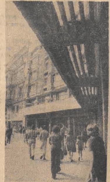
Fragment Placu Wolności