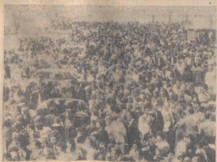
Mimo że benzyna jest droga, zainteresowanie samochodami nie maleje. 14 bm. tysiące mieszkańców Frankfurtu (RFN) zwiędziało Międzynarodową Wystawę Samochodową w tym mieście.