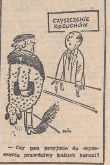
— Czy pan przyjmie do czyszczenia prawdziwy kożuch barani?