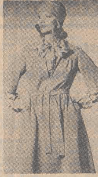
Jerseyowa sukienka — wygodna praktyczna na różne okazje...

poprawy ich jakości ogłoszono ósmy z kolei Krajowy Konkurs Opakowań „Złoty Kasztan”. Przedmiotem konkursu są nie tylko same opakowania, ale maszyny pakujące oraz systemy pakowania. Najlepsze przedmioty będą nagrodzone, a ponadto mogą uczestniczyć w Europejskim Konkursie Opakowań „Eurostar”. Organizatorem konkursu jest Centralny Ośrodek Badawczo-Rozwojowy Opakowań w Warszawie (Konstancjańska 11). (lk)