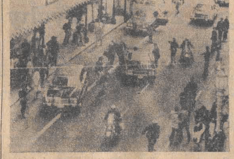
Niz: scena przed hotelem w San Francisco tuż po zamachu. W środku samochód prezydenta Forda.

W poniedziałek wieczorem w San Francisco dokonano drugiej w ciągu ostatnich 17 dni próby zamachu na życie prezydenta USA, Geralda Forda. Zabójstwa usiłowała dokonać 45-letnia Sarah Jean Moore, która oddała do G. Forda strzał z pistoletu kalibru 38, z odległości 13 m w czasie, gdy wychodził z hotelu „St. Francis” i wsiadał do opancerzonego samochodu.