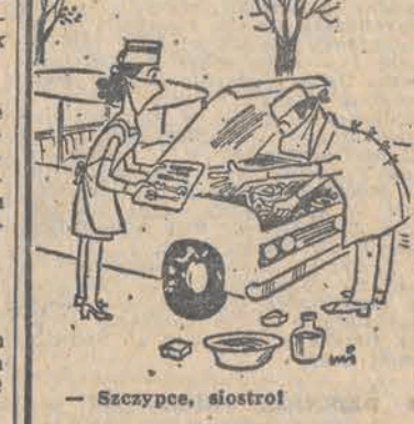
— Szczypce, siostrot