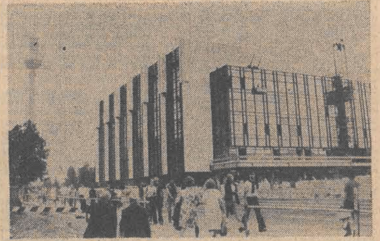
Pałac republiki - imponujący gmach, który wyrósł w samym centrum stolicy NRD, już za pół roku otworzy podwoje.