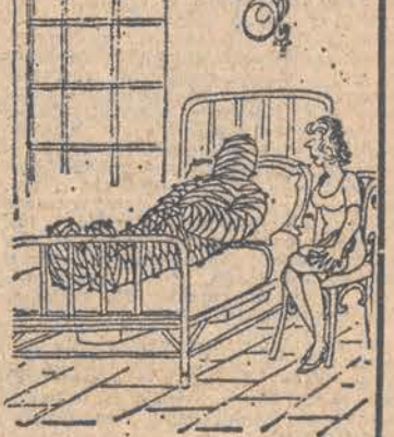
- A właściwie, to gdzie cię boli, kochanie?