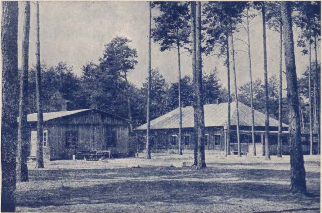
Kolonia letnia Ubezpieczalni Społecznej w Tomaszowie Maz. we własnym lasku nad Pilicą.