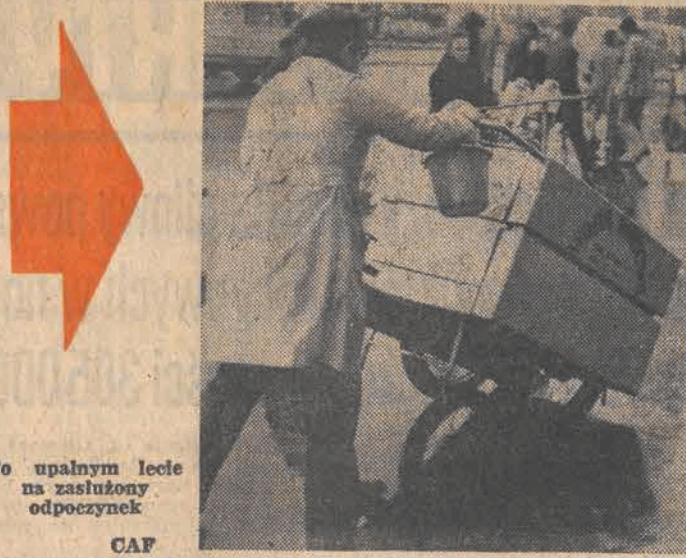
Po upalnym lecie na zasłużony odpoczynek