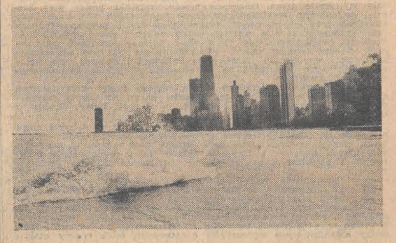
Chicago, zwane miastem wiatrów, ciągnie się na przestrzeni 40 km wzdłuż jeziora Michigan. Przy silnym wietrze przybrzeżne fale wyglądają malowniczo...