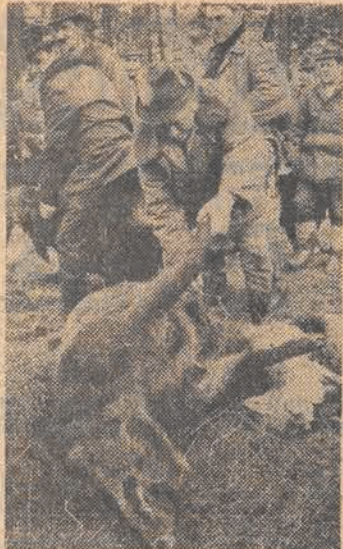
Pierwsza oflara polowania, okazała się dzik-odyniec.

W ten właśnie sposób sens zapatrywania tej kategorii funkcjo-