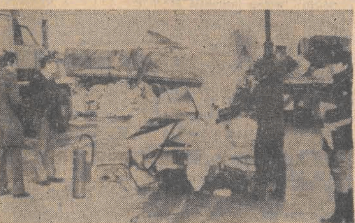
Na autostradzie w pobliżu Osnabrück (RFN) doszło do czołowego zderzenia dwóch samochodów osobowych. 7 osób zginęło.