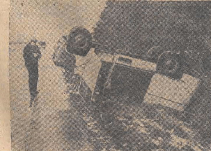
Pierwszy śnieg i pierwsze wypadki wynikające z nieostrożnej jazdy po oblodzonych drogach. N/z: na autostradzie koło Kamiennej Góry w woj. jeleniogórskim.

Gości powitał i z dorobkiem łódzkiego ośrodka kinematografii zapoznał dyrektor WFF - W. Budzyński. Z jego wystąpienia odnotujemy choć krótko bilansujące działalność łódzkiej wytwórni. I tak WFF ma na swym koncie 650 filmów dla kin i TV, WFO - 2.700 tytułów, a „Se-Ma-For” - 600. W czasie droczystego spotkania w WFF wysokimi odznaczeniami (Dalszy ciąg na str. 2)