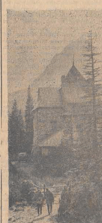
Potożone niemal w środku polskich Tatrz na wysokości 1500 m schronisko „Murowaniec” liczy już 50 lat.