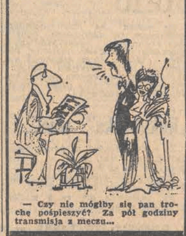
— Czy nie mógłby się pan trochę pośpieszyć? Za pół godziny transmisja z meczu...