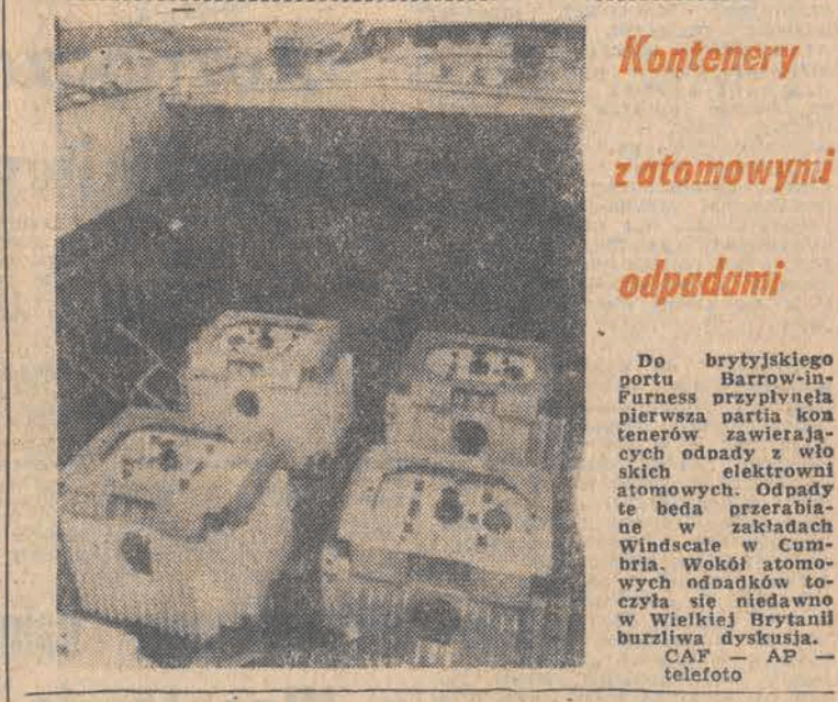
Kontenery z atomowymi odpadami

Stoją więc przed wszystkimi placówkami kształtująco-wychowującymi ogromne zadania, których efektem ma być przygotowanie najmłodszych pokoleń Polaków do współrealizacji ambitnych zamierzeń, które stawiamy sobie dzisiaj na lata przyszłe. Konieczne jest więc ciągle doskonalenie systemu oświatowo-wychowawczego i podnoszenie kwalifikacji ludzi w nim pracujących, lecz aby proces wychowawczy przebiegał prawidłowo potrzebna jest placówkom i instytucjom wychowującym pomoc całego społeczeństwa, gdyż tylko taka integracja celów i środków może więc ciągle doskonalenie systemu (Dalszy ciąg na str. 2)