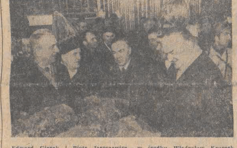
Edward Gierek i Piotr Jaroszewicz, w środku Władysław Kruczek, przy pierwszym wózku z wydobytym węglem.

W poczuciu satysfakcji z rzetelnie wykonanej pracy, w nastroju dumy z licznych osiągnięć społeczno-produkcyjnych obchodzili swoje doroczne święto — „Dzień Górnika” wieloset tysięczna rzesza pracowników polskiego przemysłu wydobywczego: węgla z górnikami najmłodszych zagłębi — lubelskiego i bełchatowskiego, z górnikami siarki, miedzi, ropy, soli i innych kopalni. Szczególnie bogaty dorobek mają w roku VII Zjazdu partii załogi górnictwa węglowego. Uzyskały one nie notowane dotychczas przyrost rocznego wydobycia węgla o ok. 9,6 mln ton. Łącznie, w całym 5-leciu polscy górnicy dostarczyli 786,4 mln ton węgla. Jest to o 6,3 mln ton więcej niż pierwotnie zakładano. Rekordowa wysokość uzyskali w bież. roku również eksport naszego „czarnego złota” przekraczając po raz pierwszy 40 mln ton.