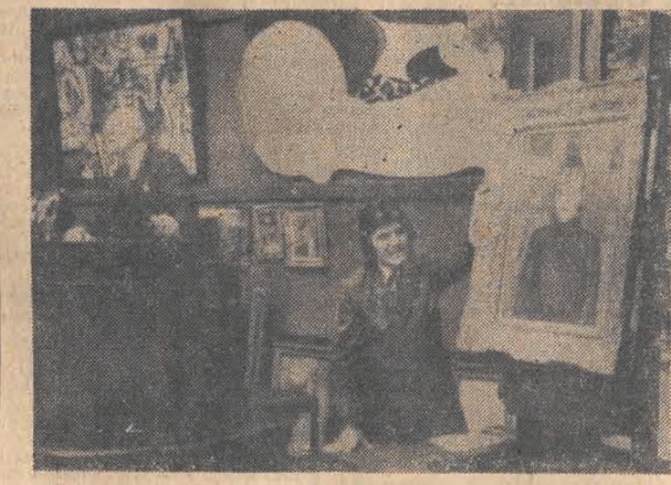
2 bm. na aukcji w Londynie sprzedany został za sumę 460.000 dolarów obraz Toulouse-Lautreca „Fille a l'acrocche-coeur”.