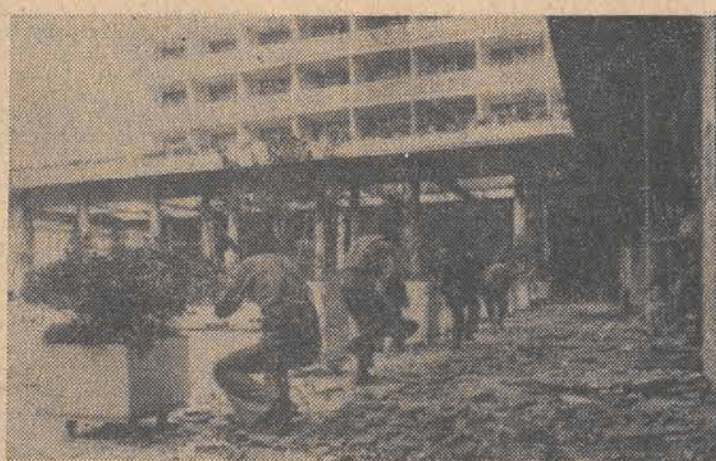
N/z: oddział muzeumski ostrzeliwuje hotel PHOENICIA.