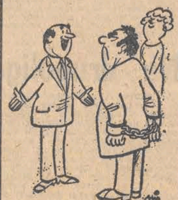
— Już od tygodnia nie palisz? Gratuluję!