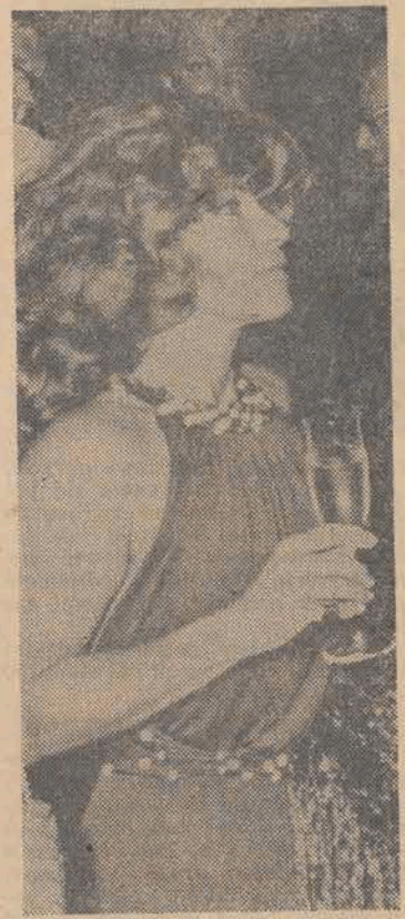
Nasza rozmówczyni oglądała pokaz Haute Couture w Paryżu...