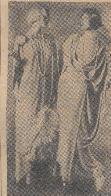
nowić się, czy odnajdziemy się w tej epoce i stylu. Jeśli nie — tragedii też nie ma. Nie to przecież sprawy są najważniejsze...

mienie ma energiczną, współczesną Ewę w kobiecie nieco „zagubiona i romantyczna”!