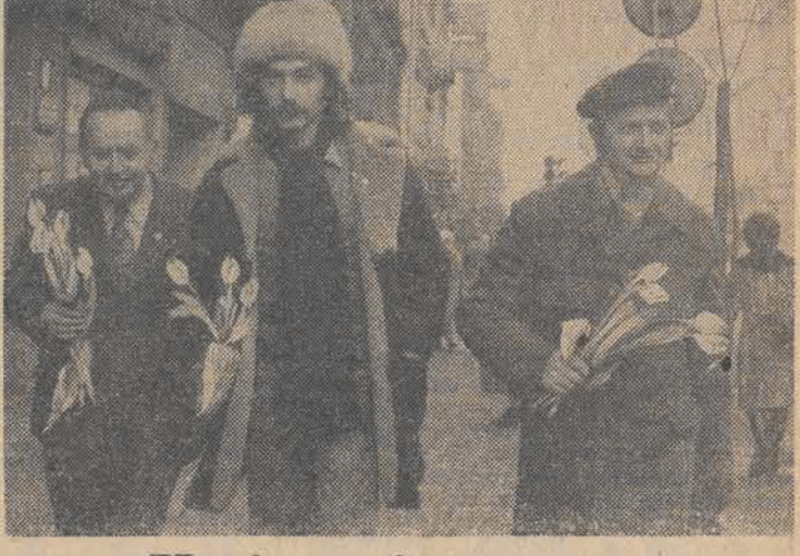
Kwiaty i serca...

Wczoraj odbyło się także przekazanie do użytku - na 4 miesiące przed terminem - złobka na Chojnach przy ul. Lelewela 11.