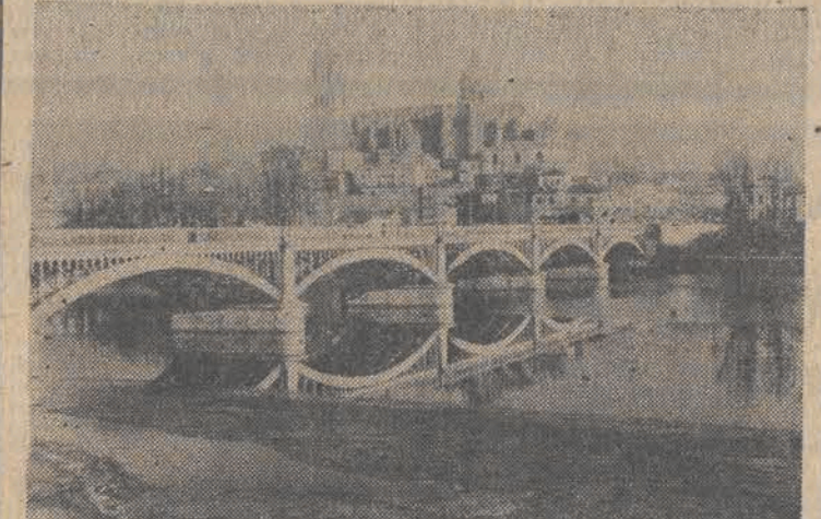
HISZPANIA. Most na rzece Tormes w Salamance, słynącej z licznych zabytków — m. in. dwóch katedr wiodących w głębi oraz założonego w 1200 roku uniwersytetu.