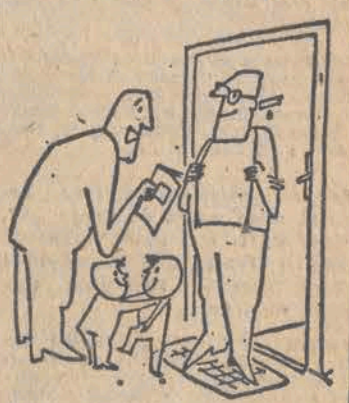
— Proponuję sąsiadka kooperację, pan będzie wykonywał zadania z polskiego, a ja z zachodniego...