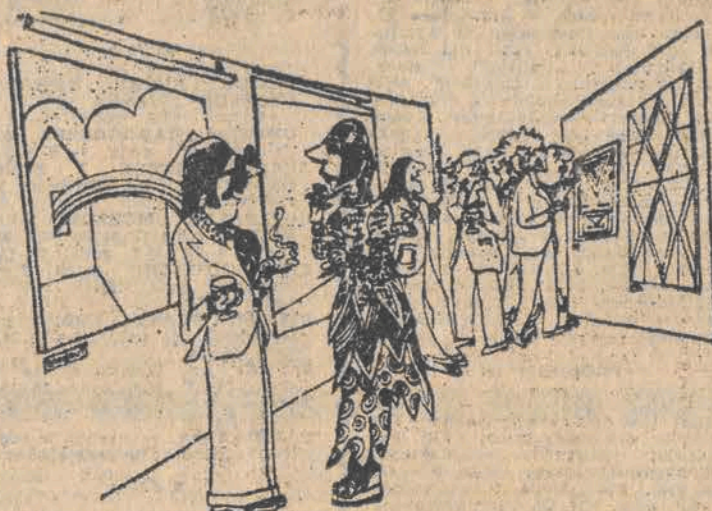
- Niewiele znam się na sztuce, ale wiem, o czym należy dobrze mówić...

Już w kilka miesięcy po ukazaniu się w sprzedaży tego pistoletu (cena 199,50 dol. wydanie „kieszonkowe” o mniejszej sile rażenia) policja zaczęła notować wzrastającą liczbę napaść rabunkowych, w których nie ofiary, a bandyci użyli „Tasera” (taką nosi nazwę). Broń uznano za „szczególnie niebezpieczną”, ale dalej kupić ją może każdy.