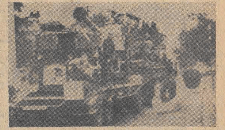
Na zdjęciu: transport czołgów do centrum Buenos Aires.

Przewidywany od wielu miesięcy - o przejęciu władzy przez siły wojskowy zamach stanu w Argentynie stał się w środę faktem dokonany. Na 27 milionów Argentynczyków we wczesnych godzinach rannych oczekiwał już pierwszy komunikat nowej ekipy z Scasa Rosada - siedziby rządowej Buenos Aires ... o przejęciu władzy przez siły zbrojne kraju. W następujących komunikatach podano, że na czele rządzącej ekipy wojskowej stanął 50-letni generał Jorge E. Videla. Obsadzone zostały również kluczowe... (Dalszy ciąg na str. 2)