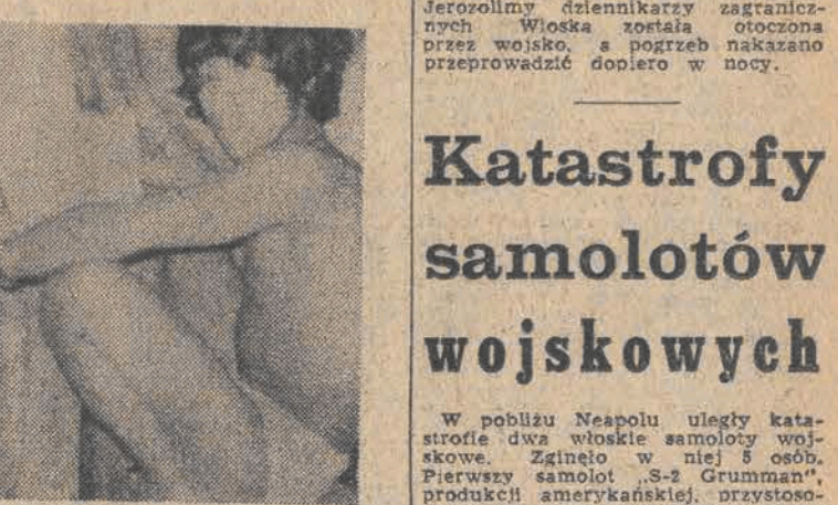
Już od 26 dni dwóch górników w kopalni złota w Piacer na Filipinach przebywa w zasypanym szybie. 22 bm. ekipy ratownicze przewierciły otwór dostarczając uwięzionym żywność. Prace zmierzające do wydobywania górników przebiegają pomyślnie. Zdjęcie zrobili sami górnicy miniaturową kamerą dostarczoną im przez ten sam otwór.