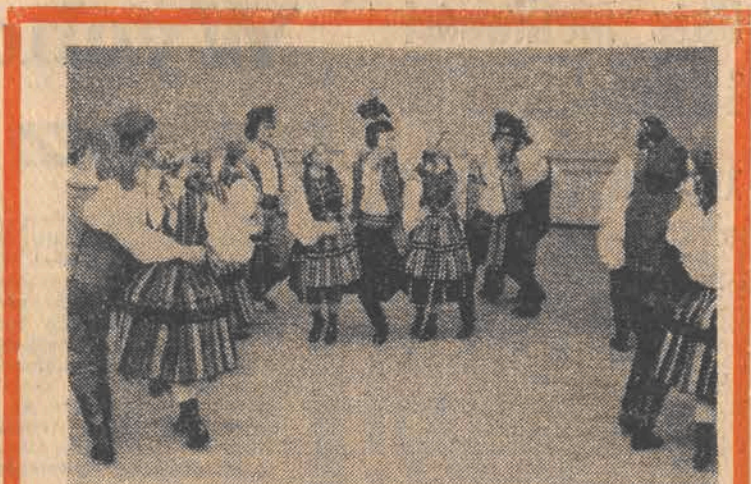
Zespół Pieśni i Tańca im. J. Strzelczyka istnieje od 1948 r., a od 1956 działa przy Łódzkim Domu Kultury. W tym czasie wystąpił 800 razy — w Łodzi i w innych miastach Polski oraz za granicą. Oglądali go widzowie w NRD, Rumuni, Anglii, Belgii, Jugosławii i Związku Radzieckim.

a kolejne zadania w tej dziedzinie formułuje program działania łódzkiej oświaty w latach 1976—80. I tak np. realizacja koncepcji szkoły otwartej zapewni m. in. rozszerzenie opieki wychowawczej nad dziećmi i młodzieżą w czasie wolnym.