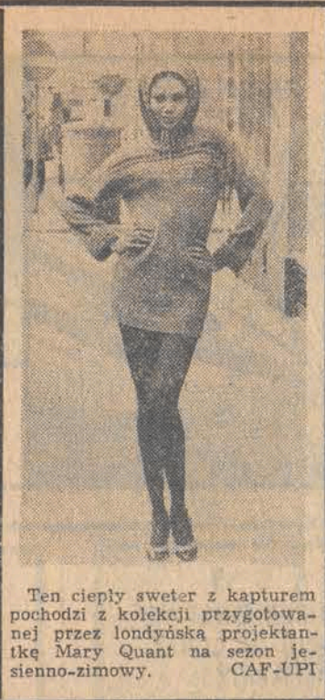
Ten ciepły sweter z kapturem pochodzi z kolekcji przygotowanej przez londyńską projektantkę Mary Quant na sezon jesienno-zimowy.

Jednostka „obrosła” już dobrą tradycją i dobrą sławą w mieście i poza jego granicami. Jej żołnierze pracują dla wszystkich, doskonale są także dla siebie, ku satysfakcji najbliższych.