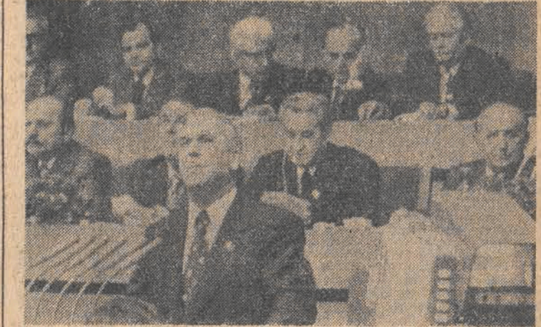
Na zdjęciu: przemawia I sekretarz KC PZPR tow. Edward Gierk.

W drugim dniu obrad XI Zjazdu Bułgarskiej Partii Komunistycznej, toczyła się dyskusja nad referatem sprawozdawczo-wyborczym, wygłoszonym przez I sekretarza KC BPK, Todora Ziłkowa. Obrady przebiegały w atmosferze pełnego poparcia delegatów dla polityki BPK, działalności jej Komitetu Centralnego oraz programu zamierzeń na lata bieżącej pięcioletki (1976—1980).