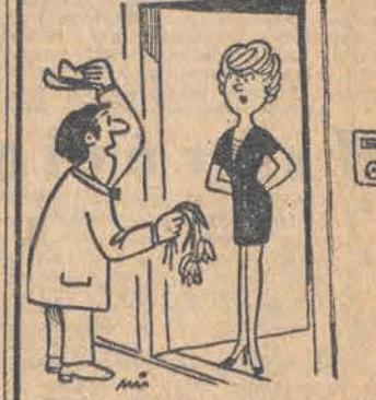
- Te kwiaty kupiłem dla pani na urodziny, ale mi miałem wtedy czasu przyjechać...

Taka sobie myśl Człowiek stworzony jest po to, aby szukał prawdy, a nie by ją posiadał.