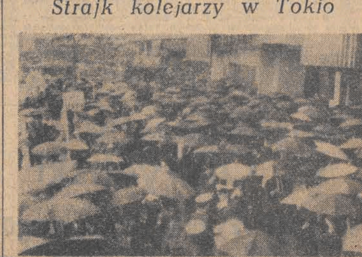
14 bm. odbył się strajk pracowników kolei, którzy domagali się podwyższenia płac i polepszenia warunków pracy. Nizki tłumy oczekujące w deszczu na dworcu w Tokio.