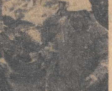
W sprawie możliwości przedstąpienia się byłego generała do RFN w przypadku gdyby miał trudności w Szwajcarii, gdzie uzyskał prawo pobytu - o ile nie będzie prowadził żadnej działalności politycznej.

Tygodnik „Stern” zamieścił w najnowszym numerze z 14 bm. kolejny materiał zbiorczy dotyczący przegotowania Antonio de Spinoli do dokonania zbrojnego zamachu stanu w Portugalii.