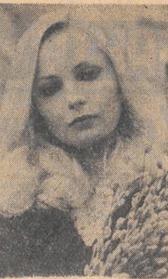
Z nadejściem wiosny dziewczyny wypiekły.

Coś trzeba zrobić z tym problemem wyjazdów ze Spaty. Nie wiem czy coś stoi na przeszkodzie, żeby tym pustym autobusom do Tomaszowa przedłużyć trasę do Łodzi. A może uruchomić dodatkowe? O godz. 16.50 (w środę 21 kwietnia) we wsi Karpin stał na podwórku jednego z domów autobus PKS z doczepą. Na kogo tam czekał? Był pusty. Chyba nie ze spłaty, bo stałby na poboczu. Widać rezerwy są. Nie ja jednak będą je uruchamiać... p.