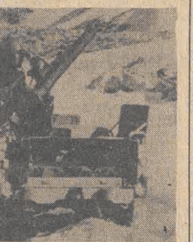
Niz: żołnierze ugrupowań lewicowych ostrzelują pozycje prawicowych falangistów w miejscowości Faraya pod Bjrutem.