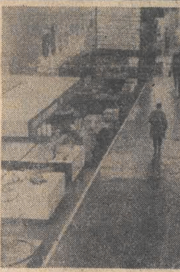
W 48. Międzynarodowych Targach Poznańskich bierze udział ponad 4100 wystawców z 34 krajów, a wśród nich wiele firm Republiki Federalnej Niemiec. N/z: w pawilonie RFN.

W Hasselt (Belgia) zakończył się V Europejski Festiwal Polonijnych Zespołów Pieśni i Tańca. Brały w nim udział zespoły z Belgii, Holandii, Francji i RFN oraz krajowy zespół „Opoczno”.