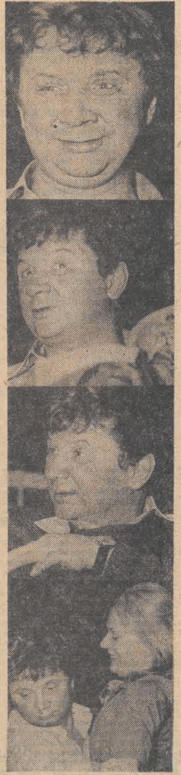
całemu zespołowi Teatru Powszechnego udaną realizację ambitnych zamierzeń.