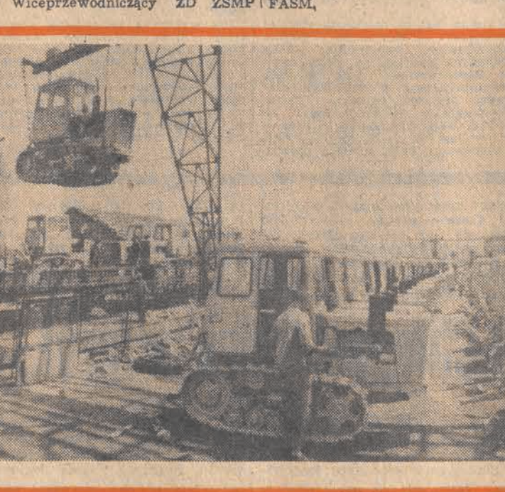
CAF — BTA

fakże zrealizować własne marzenia. Zaczęli od sterty gruzu i złomu na terenie swojego zakładu. Kupili za te parę tysięcy złotych kostiumy dla swojej drużyny piłkarskiej. Drugie zadanie — regulacja i malowanie plotu. Siedem osób mogło już wtedy wyjechać na wycieczkę do Pragi i Budapesztu. Zostało jeszcze troszkę na potrzeby ogółu. Tak było rok temu, a teraz ten i ów przebąkuje nieśmiało, że jeszcze trochę a fundusz socjalny Zespołu EC będzie przy FASM Kopicuskiem. Wiceprzewodniczący ZD ZSMP