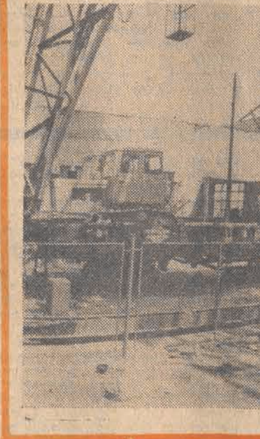
CAF — BTA

Bułgarskie rolnictwo Bułgarskie rolnictwo dysponuje obecnie przeszło 133 tysiącami traktorów. Na zdjęciu: traktor „Bolgar” produkowane w fabryce w Kartowie, przeznaczane są głównie do prac polowych na plantacjach warzyw i w sadach; eksportuje się je do kilkudziesięciu krajów. CAF — BTA