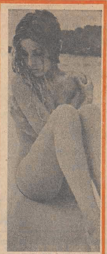
Nadeszła jesień. Na plażach coraz chłodniej...

W czasach ciężkiego kryzysu światowego trudno jest o dobrą transakcję eksportową. Ogólnie zazdrości się więc Islandczykom, którzy podpisali umowę na sprzedaż gorącej wody z gejzerów do Szwecji, a także Norwegom, którzy pertraktują w sprawie dostaw życiodajnego pynu dla dotkniętej katastrofalną suszą Wielkiej Brytanii. Wybrańcami fortuny są też sąsiedzi republiki Singapuru, minipaństwa o powierzchni 581 km kw. i rekordowej gęstości zaludnienia 3821 dusz na 1 km kw. Aby powiększyć swe wyspiarskie terytorium, Singapur postanowił budować na płasku, którym zasypie się pływiczny morskie. Oczywiście potrzebne są do tego niewyważalne ilości syplekiego surowca. Właśnie podpisano w Dżakarcie umowę z Indonezją na dostawę piasku wartości 75.000.000 dolarów i zachęca się innych potencjalnych eksporterów do składania ofert.