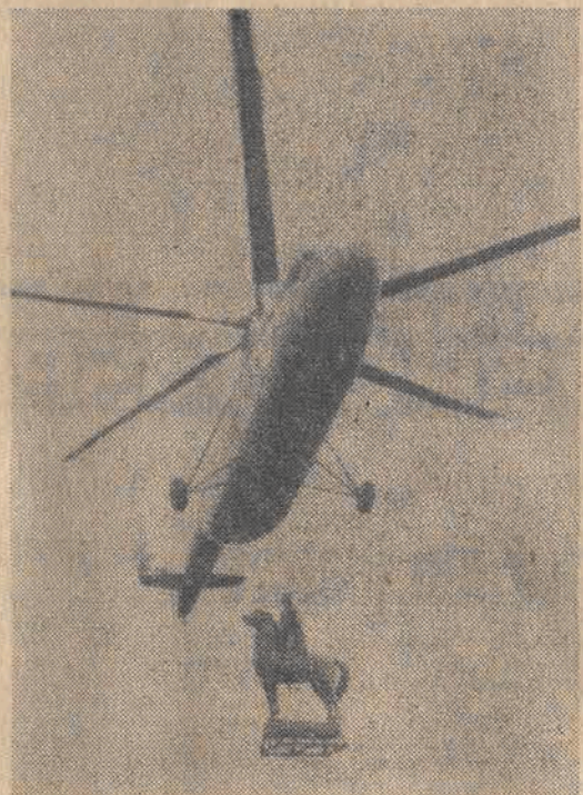
Na zdjęciu: moment przed lądowaniem śmigłowca w Krakowie.

28 bm. pilot „Instal” z Naselska k. Warszawy przetransportował drogą powietrzną z Gliwic odlane w bagażu figury rekonstruowanego Pomnika Grunwaldzkiego w Krakowie. Operacja, która trwała kilka godzin i wywołała duże zainteresowanie na całej trasie przelotu — została starannie przygotowana.