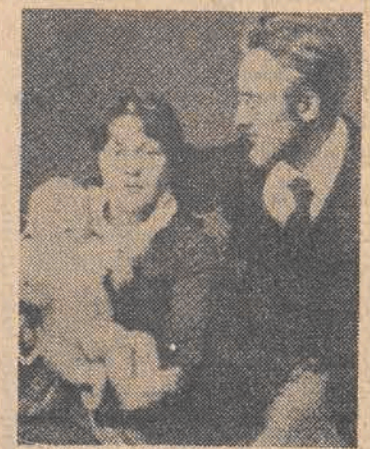
Miał 33 lata — gdy po raz ostatni zobaczył światło dnia, leżąc na nędznej przyści w twierdzy szlisselburskiej. Jego ziemski dorobek — to walka do ostatnich chwil o sprawę robotniczą — wzięcia, procesy, ucieczki, katorga... Na zdjęciu: L. Waryński z żoną i dzieckiem.

Z okazji 120 rocznicy urodzin Ludwika Waryńskiego odbyła się wczoraj w Iłdzkim Ośrodku Szkolenia Oficerów Politycznych, który nosi imię wielkiego rewolu-