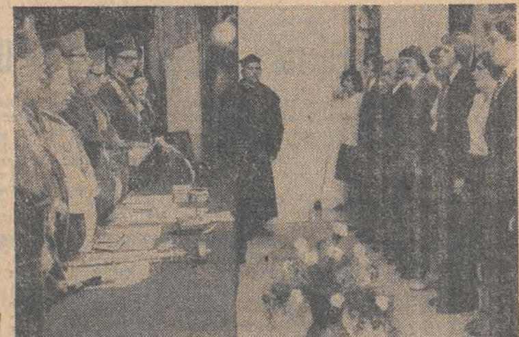
Immatrykulacja studentów I roku

Prawie 19 tys. studentów studiować będzie w roku akademickim 1976-1977 w Uniwersytecie Łódzkim.