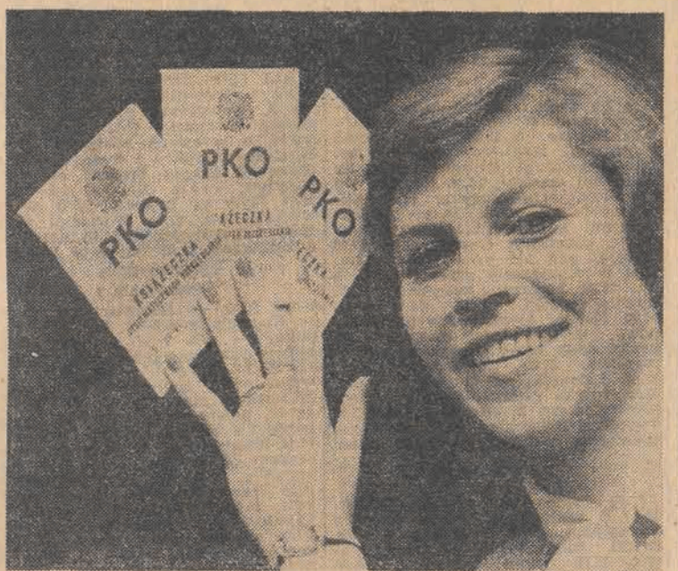
Tradycyjnie już październik ogłaszany jest miesiącem oszczędności. Warto więc, pamiętając o tym, zapoznać się z nowymi formami oszczędzania, które proponuje nam PKO.