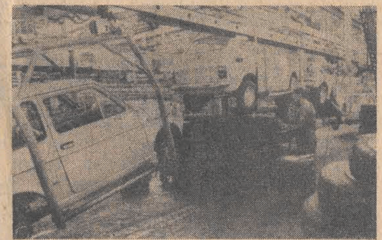
Fabryka Samochodów Małolitrażowych, której zakłady znajdują się w Bielsku Białym i Tychach, dostarczy w tym roku 80 tys. „Fiatów” i 40 tys. „Syren” wszystkich typów.