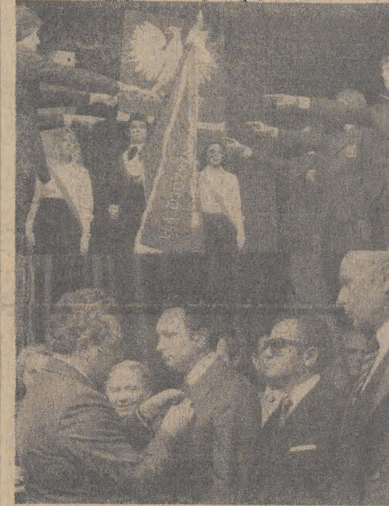
Na zdjęciu: Uczniowskie ślubowanie w Zespole Szkół Energetycznych nr 1. Dekoracja zasłużonych pracowników oświaty wysokimi odznaczeniami państwowymi.

Z całą pewnością długo pamiętać będą wczorajszy dzień nauczycieli, uczniowie i wszyscy pracownicy Zespołu Szkół Energetycznych nr 1. I nie tylko oni. Placówka ta gościła bowiem wczoraj liczne grono przedstawicieli szkolnictwa wszystkich typów, zakładów pracy, młodzież, rodziców, nauczników miast, dzielnic, gmin naszego województwa i wielu, wielu innych, którzy przybyli tu na jubileusz 30-lecia znanej i zasłużonej dla miasta szkoły.