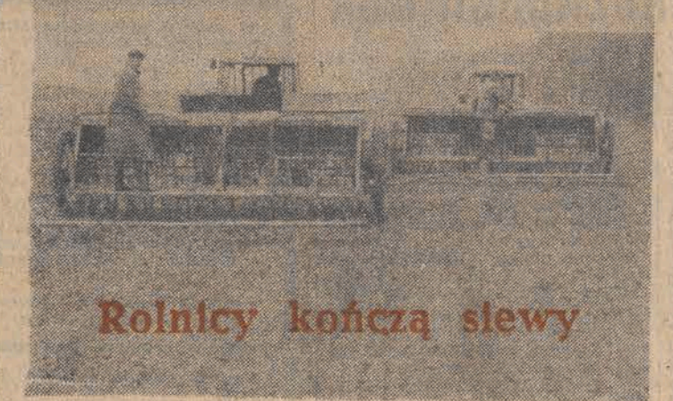
Rolnicy kończą siewy

Nawiązując do lotu oświadczył, że wszystko przebiegało sprawnie do momentu, gdy wstąpiły pewne nieprawidłowości.