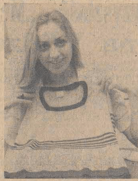
Produkcja na maszynach cotonowych (a takie pracują m. in. w „Olimpii”) nie pozwala na fantazję...

w sklepach. Kurteczki z frotte można kupić tylko za niemałe sumy w „Modzie Polskiej”, gdy tymczasem inne wyroby dzwiarzarskie zalegają magazyny i sklepy. Przykłady można by mnożyć — po cóż jednak odgrzewać stare emocje na temat golfów, rajstopów, bielizny? Trudno oprzeć się wrażeniu, że potężny przemysłowy organizm żyje własnym życiem, nie zawsze w zgodzie z potrzebami rynku. Miałby jednak narzekać, warto się zastanowić, co stanowić ma ów brakujący pomost między producentem a konsumentem? — Jak to kto? Handel — słysze stanowczo. I trudno nie przyznać racji. Można by wprawdzie rozpoznać teraz smętne rozważania, czy partner ten jest dobrze przygotowany do pełnienia odpowiedzialnych zadań. Faktem jest jednak, że innego rozwiązania nie ma... Ja zaś nie mogę zapomnieć opinii rozżalonej klientki, która — nie mogąc kupić kolorowych pończoch — wykrzyknęła w sklepie: Dlaczego się tego nie produkuje? Przecież można zrobić na tym niezły interes... ANNA TYSZEKA