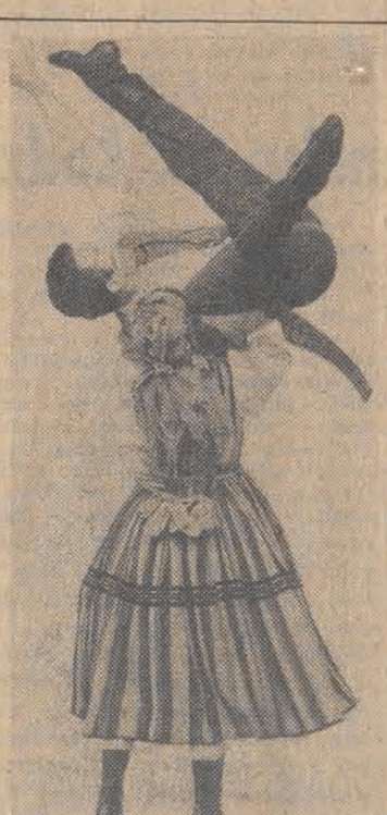
Jak zawsze - wspaniale!