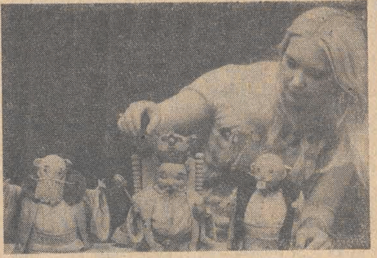
W Muzeum Historii Miasta Łodzi czynna jest retrospektywna wystawa twórczości zmarłego przed 10 laty artysty — Zenona Wasilewskiego.

kiej części tego co napisałem powyżej, czai się (jak zły wilk na Czerwonego Kapurka) zryżliwość, złośliwość i ironia.