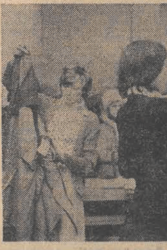
Ubiierający głównie młodzież łódzki dom towarowy „Juventus” dostał pokazań partie konfekcji z tkanin dzianinowych. Co się tam teraz dzieje — trudno opisać, a na wet pokazać na fotografiach. Niemniej — pokazujemy dwie scenki.