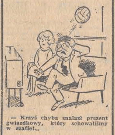
- Krzysz chyba znalazł prezent gwiazdkowy, który schował się w szafce...